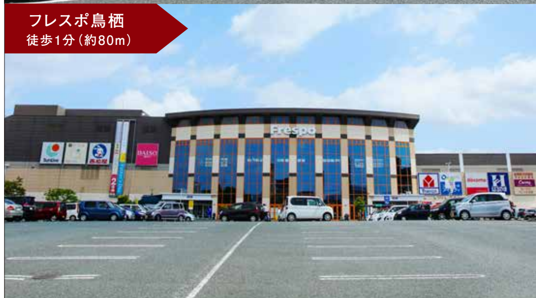
フレスポ鳥栖 徒歩1分(約80m)