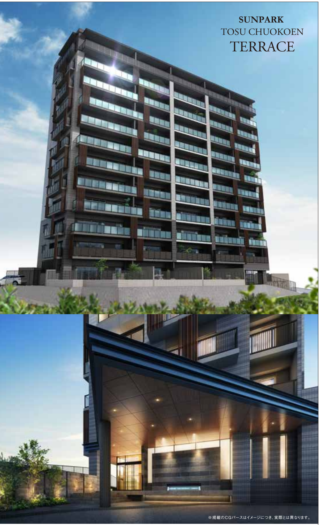
SUNPARK TOSU CHUOKOEN TERRACE