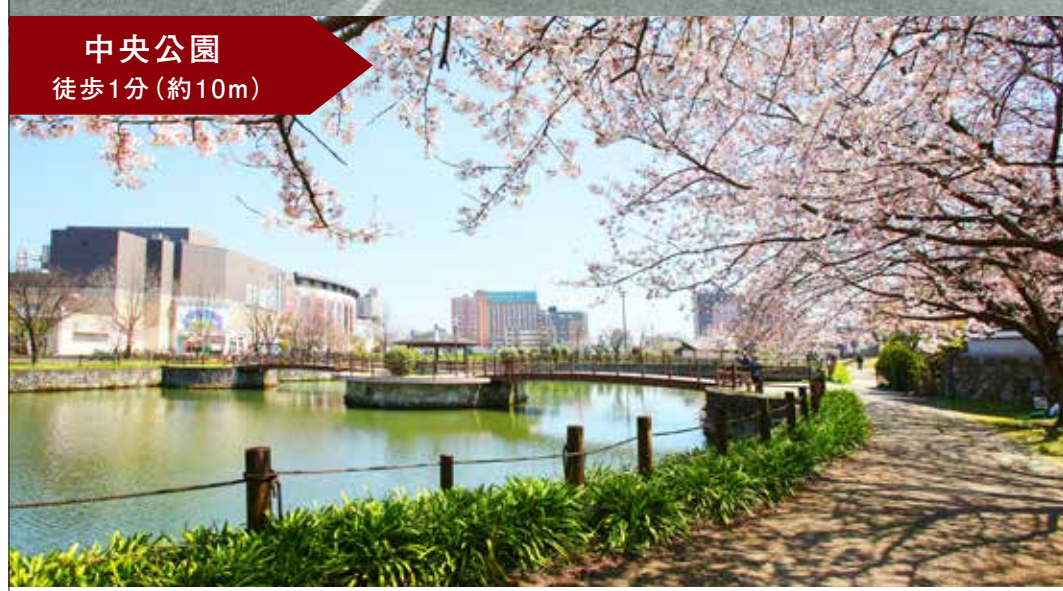
中央公園 徒歩1分(約10m)